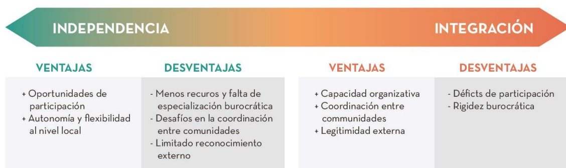
Figura 2: Comparando independencia e integración para la construcción de paz comunitaria