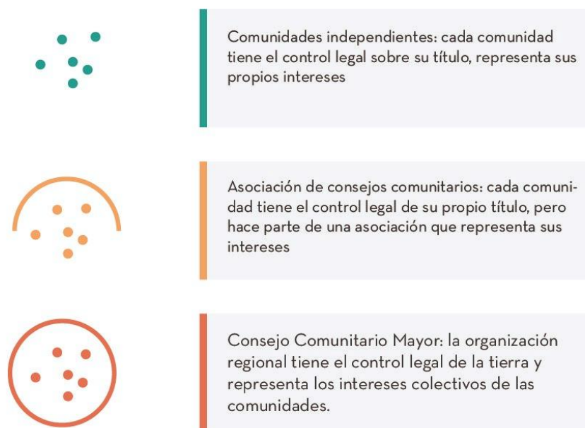
Figura 1: Grados de integración entre los consejos comunitarios

En Chocó, las comunidades han creado tres estrategias diferentes para titular sus tierras durante el proceso de titulación en la década de 1990 y principios de la de 2000. Las comunidades hicieron títulos independientes que correspondieran a su comunidad individual; o formaron grandes títulos que incluían a todas las comunidades a lo largo de una sección de una cuenca fluvial; o adoptaron una estrategia intermediaria, optando por títulos individuales de comunidades independientes, pero haciendo parte de asociaciones de consejos comunitarios para tener una representación colectiva de sus intereses. Esta variación la he definido como integración regional. Con base en estas diferencias, he creado una tipología de integración regional en tres partes, que va desde regiones atomizadas de comunidades independientes , que no participan en una organización regional y mantienen toda la autoridad legal sobre su territorio; hasta asociaciones de consejos comunitarios , en las cuales las comunidades mantienen la autoridad legal sobre sus territorios, pero participan en asociaciones regionales para representar sus intereses ante actores externos; hasta consejos comunitarios mayores altamente integrados, que concentran la autoridad legal y las funciones de representación a nivel regional.