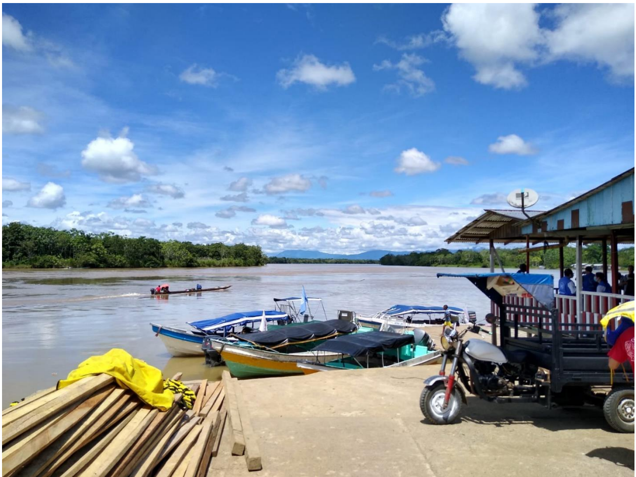
Bojayá, Chocó, Octubre 2021